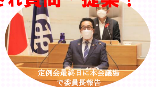
定例会最終日に本会議場で委員長報告